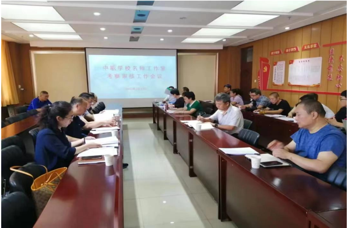
市教育局评审专家对学校申报的 11 个工作室进行评审