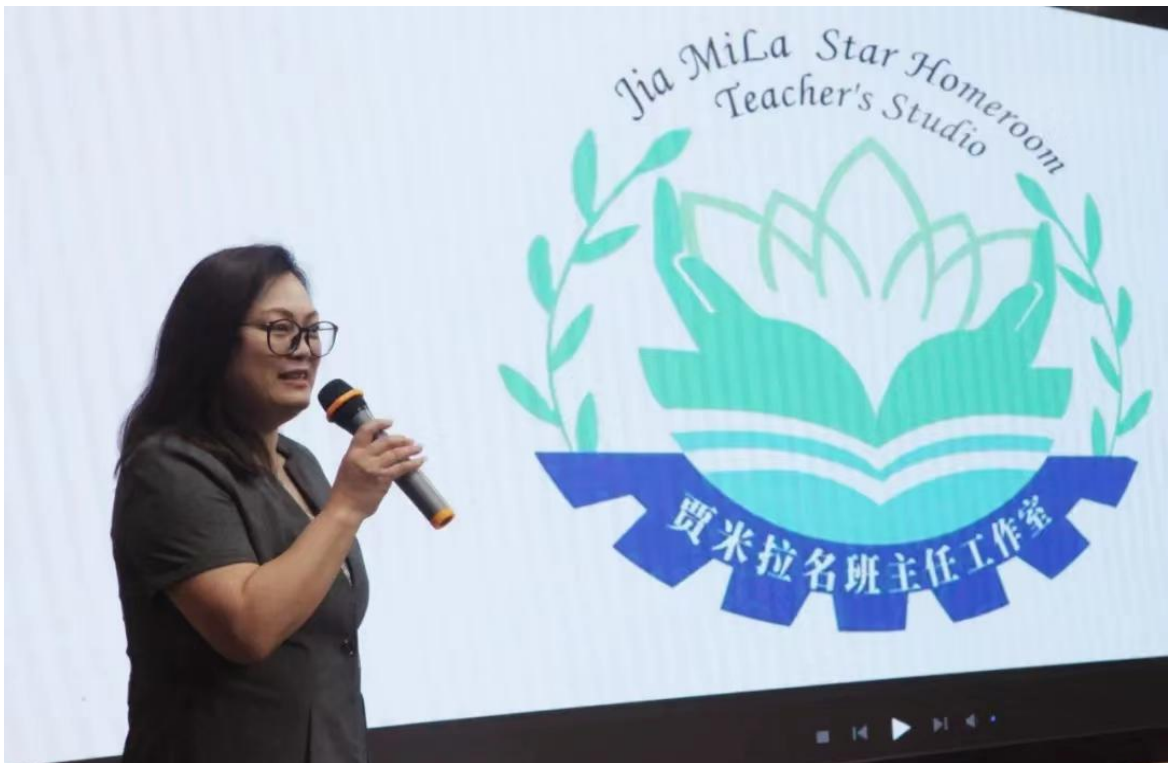
学校成立名班主任工作室，打造班主任素养提升平台