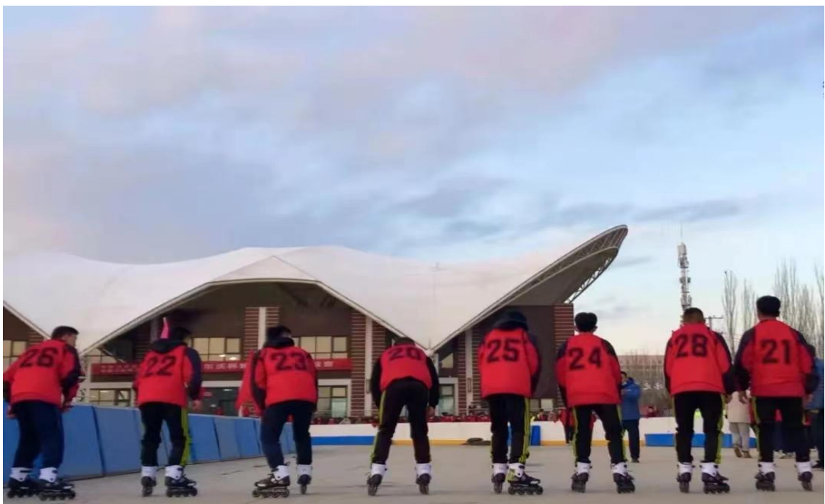
学生工作处组织学生进行“沃尔沃”杯轮滑比赛