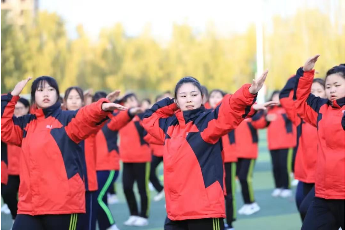
学生工作处组织“感恩奋进 一起向未来”系列活动——课间操比赛