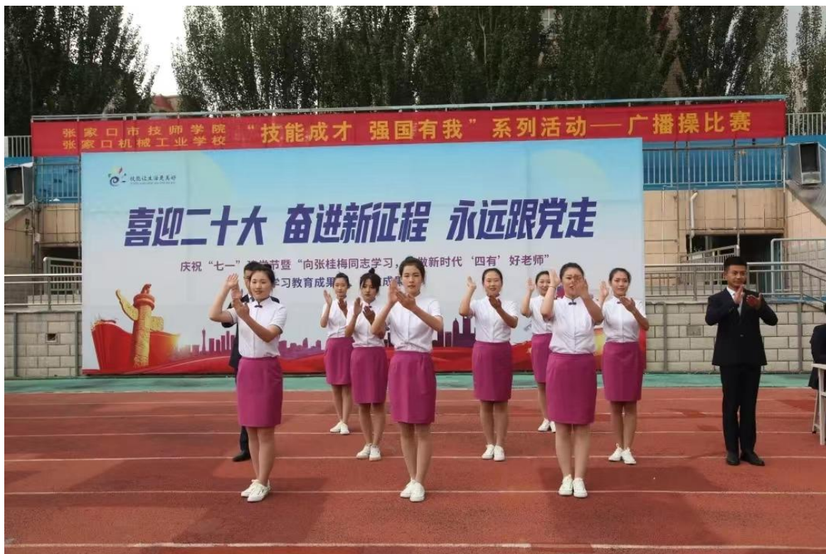
“喜迎二十大 奋进新征程 永远跟党走” “向张桂梅同志学习” 职业教育成果展