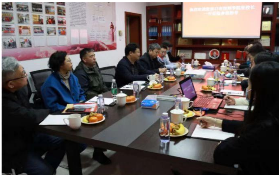
学校领导到校企合作单位 SMC（中国）有限公司进行回访

深化产教融合，持续与企业对接。学校继续与极光湾汽车发动机制造有限公司、领克汽车张家口工厂、河北燕兴机械厂、三一重工、北京奔驰等大中型企业深度合作。拓宽新的校企合作平台，与上海特斯拉汽车制造有限公司、石家庄新龙软件科技股份有限公司、远大集团建立了互惠互利的校企融合关系。校企合作组织机构健全，制度体系完善。校企通过共商人才培养培训方案、技术创新、组建冠名班、输送实习生、企业文化融入校园等多种形式为学生走进企业、走近职业奠定了坚实的基础。全面推进现代学徒制和企业新型学徒制人才培养模式，完善校企合作育人机制，校企深度融合，教师、师傅联合传授，提高了学生的专业技术实操能力，创新了技术技能人才培养模式。