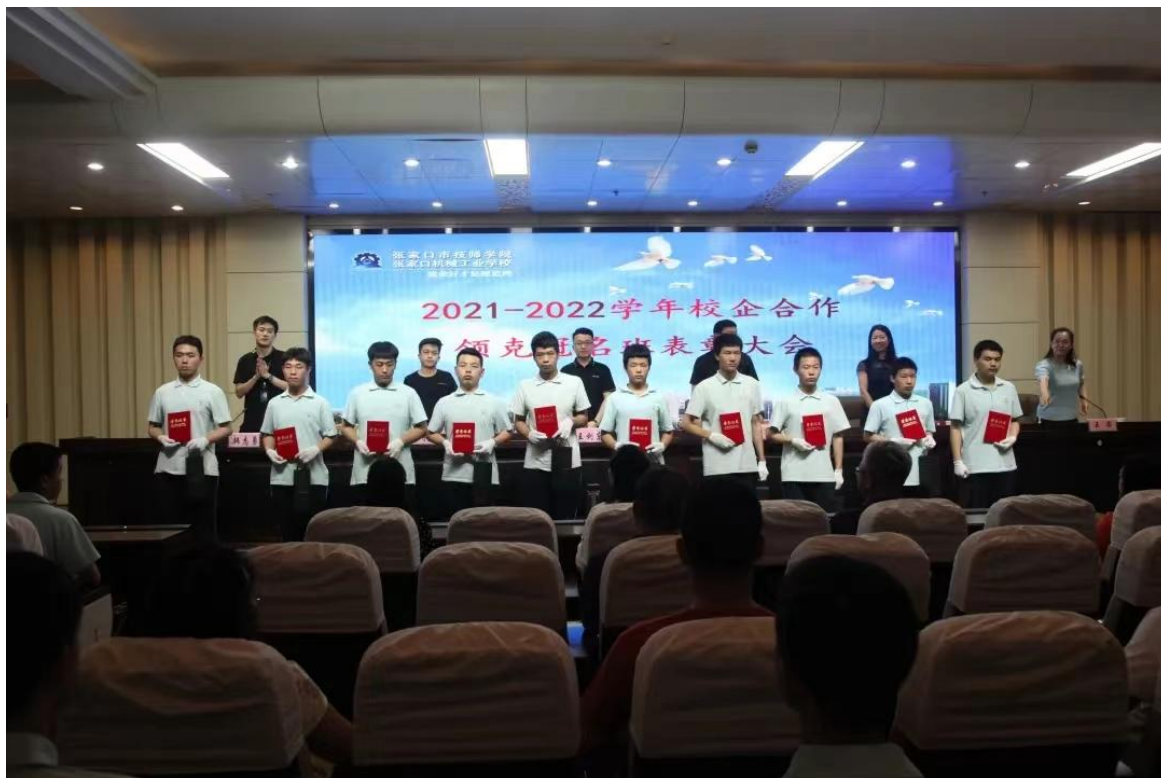
2021—2022 学年校企合作领克冠名班表彰大会

学校与领克张家口工厂开展校企合作以来，建立了长期而稳定的友谊，双方通过组建冠名班、顶岗实习等各种形式的合作方式为学生走进企业、走向社会奠定了良好的基础，不但让许多优秀的毕业生凭借一技之长实现了人生价值，同时也为企业的发展输送了优秀的高素质员工，为地方社会和经济的发展提供了有力的人才支撑。