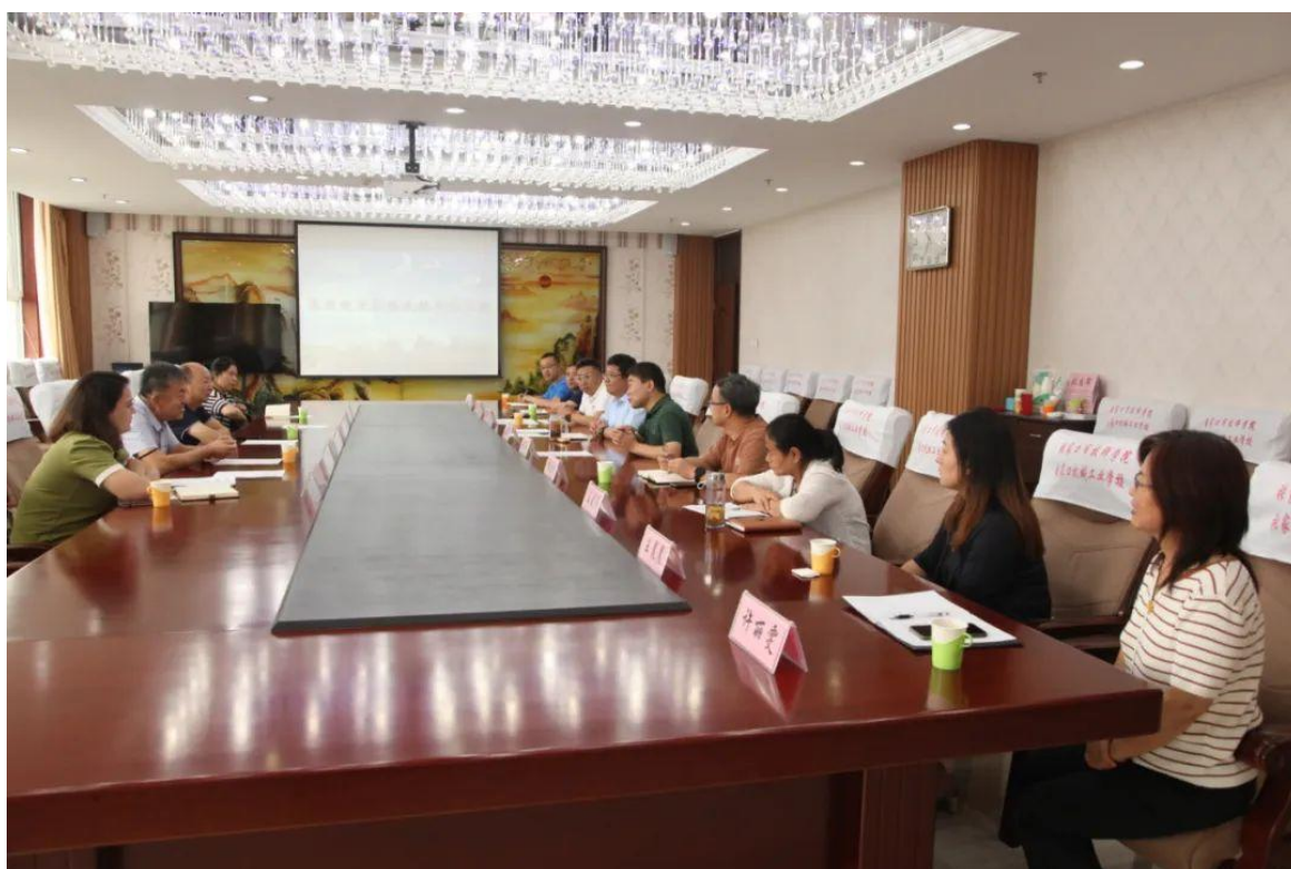
共建学校新疆和硕县职业高中领导及教师代表到学校进行深度交流